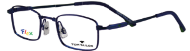
TOM TAILOR Kinderbrille